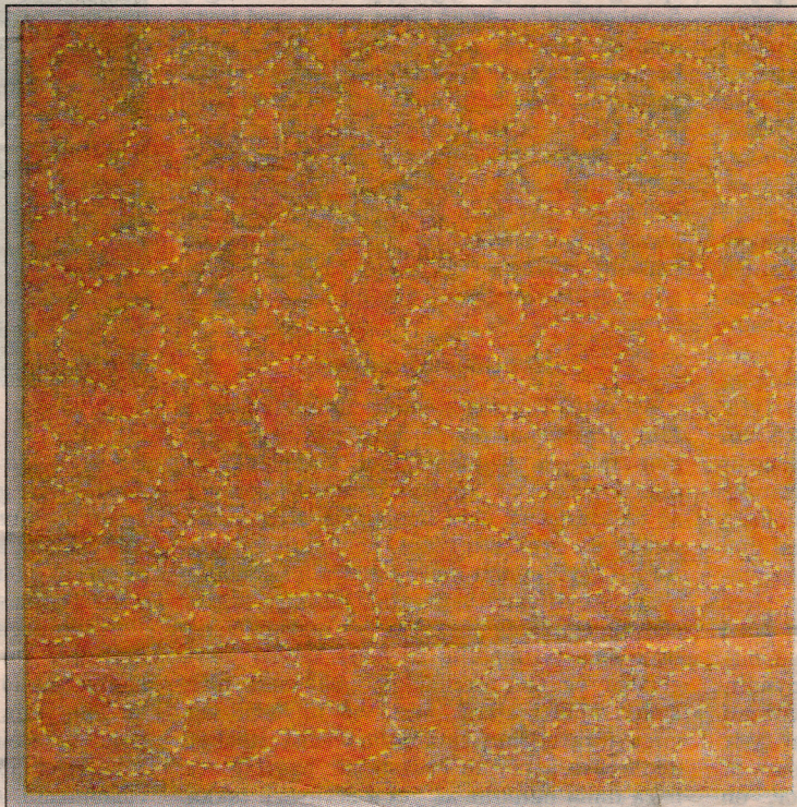
Verkið Palamus (Thalamus) 170x170 cm á sýningu Valgarðs Gunnarssonar er nefnt eftir líffæri heilans sem tekur á móti boðum skynfæranna.